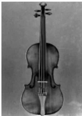
ストラディヴァリウス1717年製ヴァイオリン 「サセルノ」